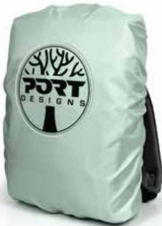
Housse de pluie incluse avec bande réfléchissante Included rain cover with light reflective band