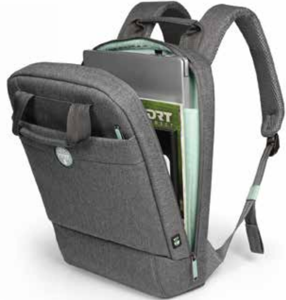
13/14" padded notebook compartment and front zipper pocket Compartment rembourré pour ordinateur portable 13/14" & poche zippée frontale