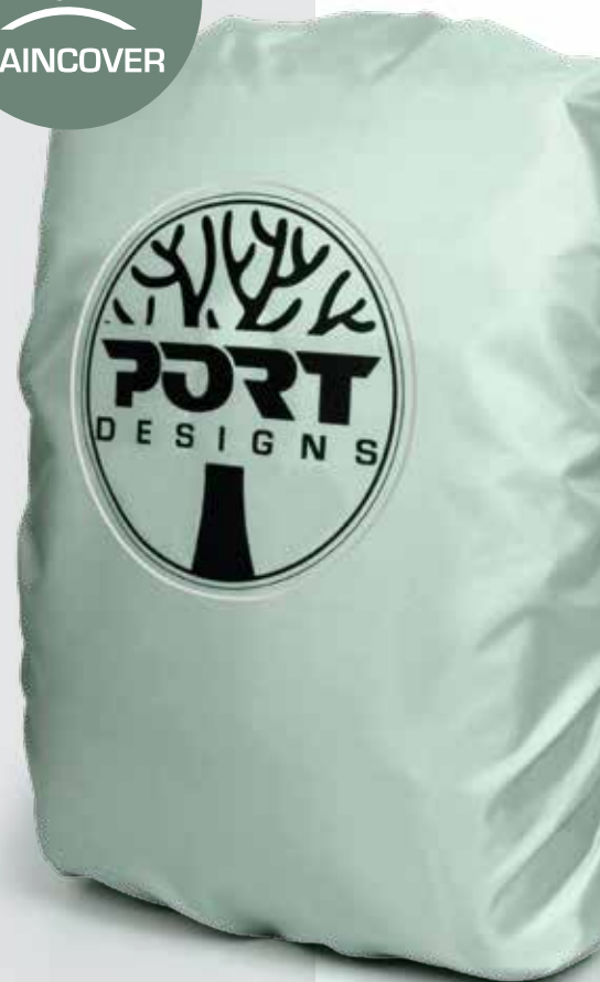
Compact & lightweight backpack Sac à dos compact & léger