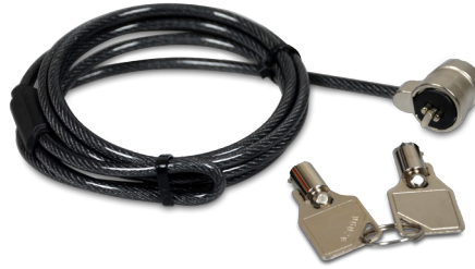
Steel braided security cable Câble de sécurité en acier tressé