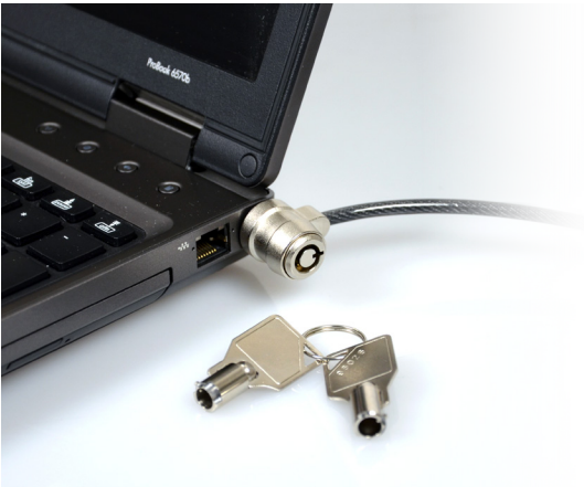
Professional security Sécurité professionnelle