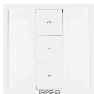
ART NR 210963-ER Väggsändare, 1-KANAL