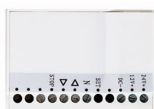
ART NO 210965-ER Dry contact transmitter