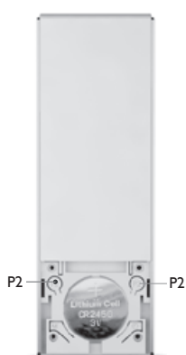
ART NO 210944-ER Remote, 1-CH

* Example of additional transmitter: Remote control, Autolink and Dry contact transmitter