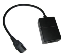
ART NO 210907-ER Autolink trigger