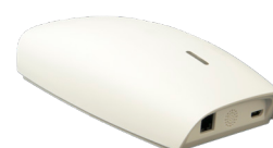
ART NR 211040-ER WiFi Box for APP-control